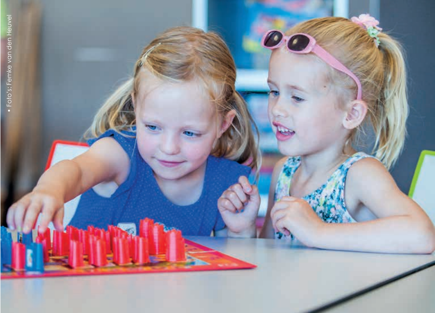
Kinderen met een ontwikkelingsvoorsprong pikken prikkels razendsnel op en verwerken deze prikkels ook razendsnel

omgeving, maar ook aan zichzelf. Een typisch voorbeeld hiervan is de kleuter die zijn tekeningen verscheurt, omdat deze niet voldoen aan het beeld dat hij ervan heeft. De vlinder op papier lijkt niet op de vlinder in zijn hoofd en is daarom niet goed genoeg. Hij legt de lat heel hoog en wil perfect werk leveren. Het helpt niet om te zeggen dat de tekening wel mooi is, want de kleuter denkt zelf dat hij de vlinder perfect zou moeten kunnen tekenen. In gesprek gaan over de tekening en de (fysieke) mogelijkheden helpt wel om het kind een